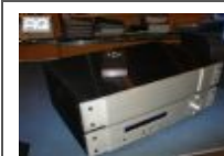
Pre-amplificatori Pass Labs X1 € 3.500,00